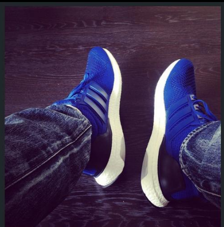
Спасибо @adidasrussia за отличный приз на #первыйзабег. Буду будить район в #ultraboost #разбудирайон #разбудисокольники