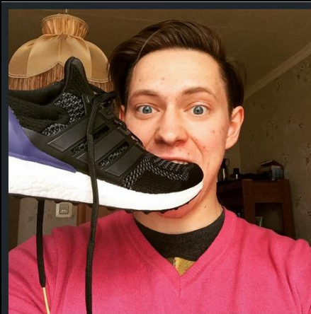
Забрал выигранные на #первыйзабег #ultraboost #adidasrunning #adidas #разбудирайон #разбудюстанцию #firstrun #motivation #moscowmarathon