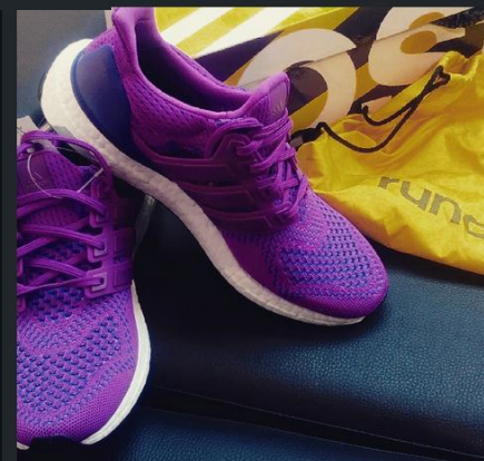
Крутые кросы! #мои#adidas#ultraboost#sokol#разбудирайон