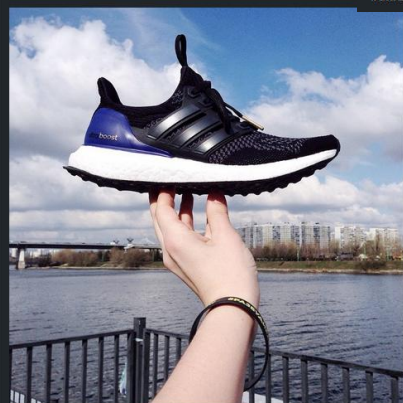
Мечта бегуна сбылась 🏃‍♀️. Эти красавчики просто 🔥. Выбрала черные в другом цвете и их не увидю. Встала сегодня с рассветом чтобы скорее испытать их и просто влюбилась. Не хочу снимать совсем!! И мои утренние 7км в колготку команде 🏃‍♀️ #разбудирайон #разбудиЦарицыно #adidasrunning #ultraboost #run #runner #runlife #running